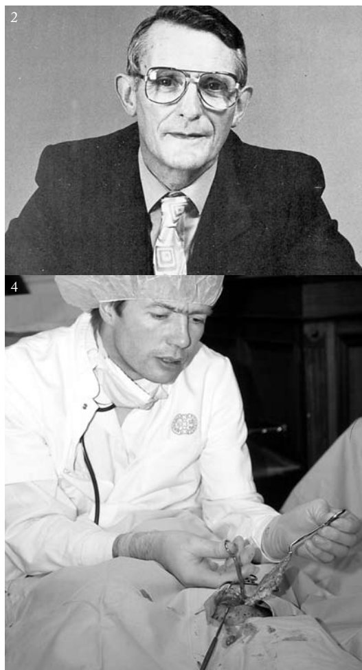
Figuur 1 t/m 4.